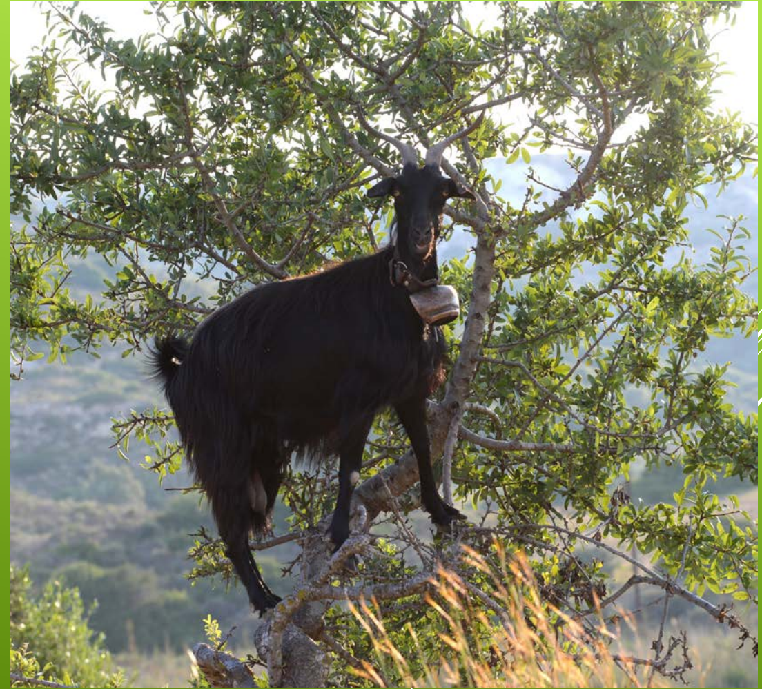
Val Bavona, Tessin, und Ziege auf Kos, Griechenland