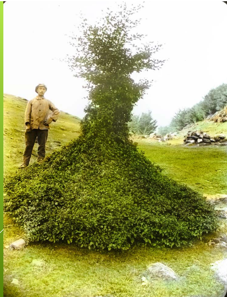
Foto : Burger Hans EAFV, 1919 Somvix, koloriertes Glasdiä aus Sammlung Wald Schweiz

Zusammengestellt von Paul Rienth für den Runden Waldtisch am 19. Mai 2026 zum Thema Waldweiden